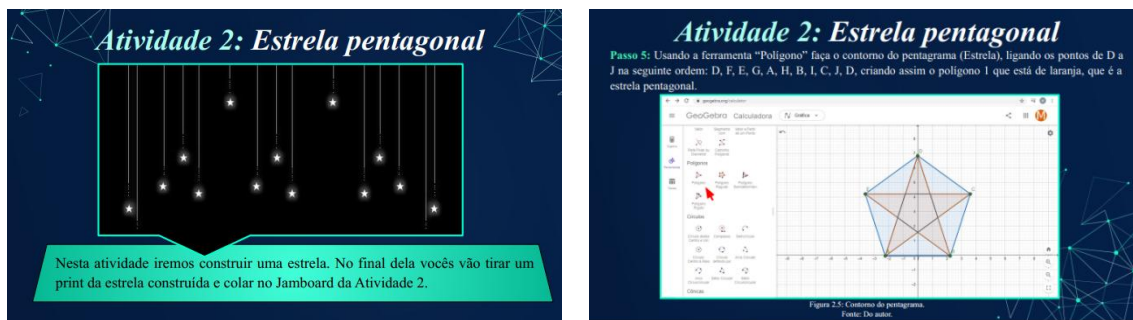
Figura 3: Atividade de uma oficina, com utilização do Jamboard e GeoGebra